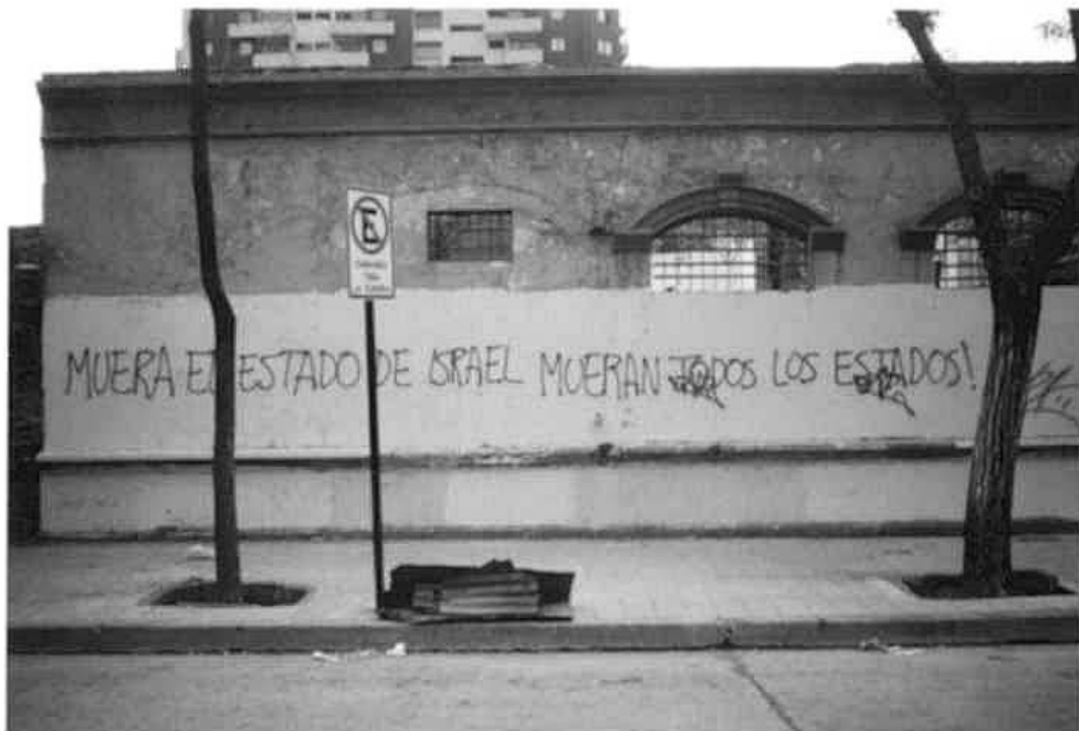
PINTADA EN LOS MUROS DE SANTIAGO DE CHILE

La burguesía pretende exorcisar la acción del proletariado con sus campañas terrorista (basadas en el antiterrorismo). La respuesta proletaria en varios rincones del mundo y particularmente en Chile, expresan la crítica proletaria no solo a la actual campaña estatal, sino a toda la sociedad burguesa. Frente al terror organizado de la burguesía, contra las campañas antiterroristas y la movilización de los proletarios en defensa del terror del estado, el proletariado mundial responde luchando contra la burguesía en todas partes.